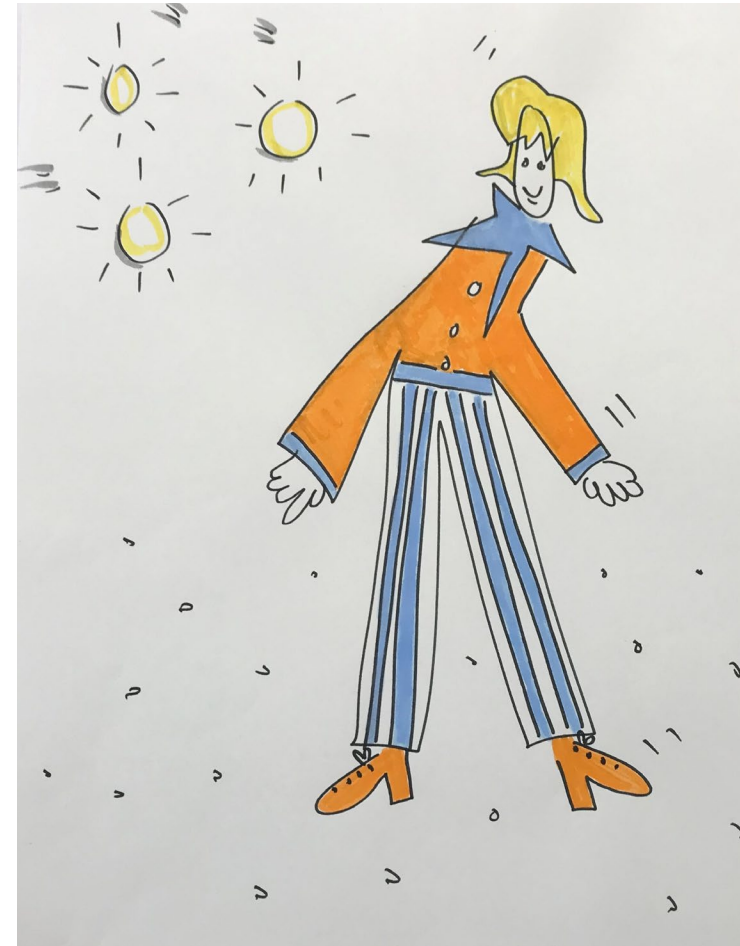
Grafik und Illustration: Silvia Staub